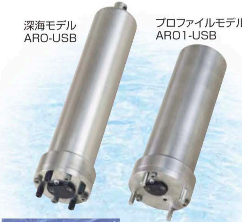
プロフィールモデル ARO1-USB