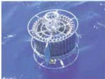
採水器に RINKO Iを装着