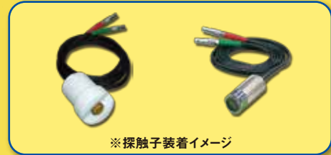
※ 探触子装着イメージ