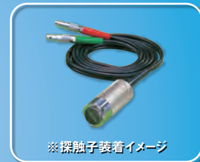
※探触子装着イメージ