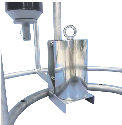
10kg錘取付時 ※オプション4個セット