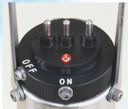
浸漬型コネクタと見やすいパイロットランプ

電気伝導度は海水、淡水いずれかをご選択ください。 ASTD10※は600m仕様 ASTD15※は1,000m仕様です。