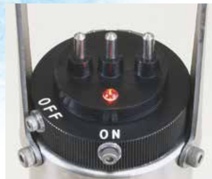
浸漬型コネクターと見やすいパイロットランプ