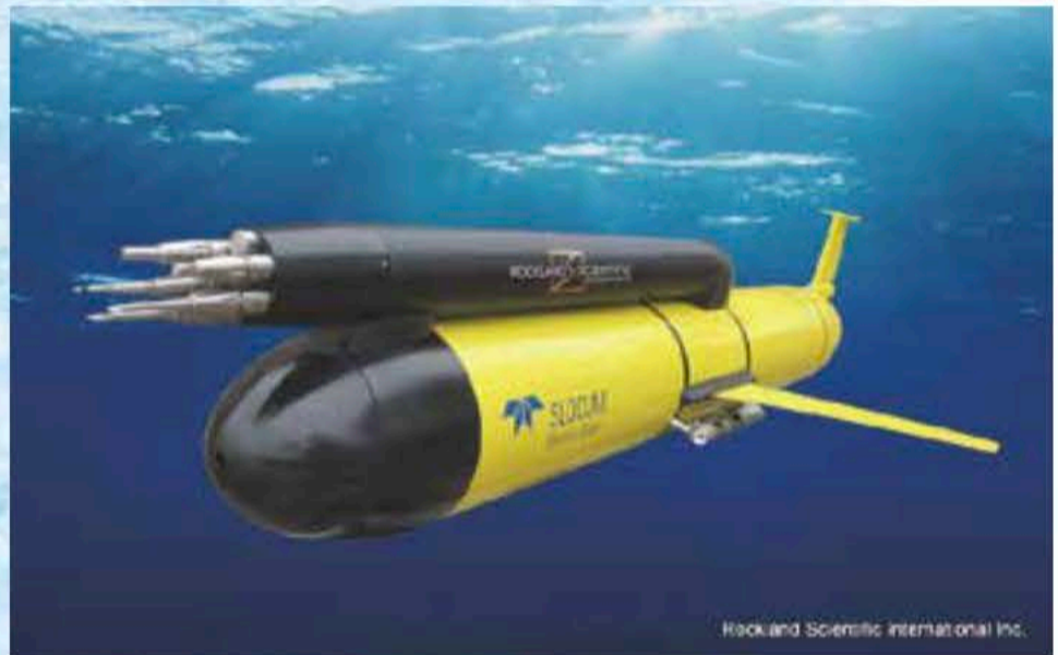
水中グライダー搭載例